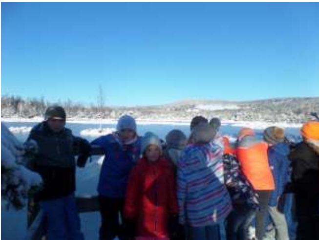
Zima na Svinné Ladě

Že jsme partnerskou školou NP Šumava, to ví dneska každý. Kromě několika programů SEV Vimperk jsme se stali účastníky celostátní akce Ptačí hodinka a přes jeden víkend počítali ptáčky na svých krmítkách.