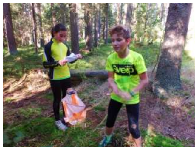
...a takhle na trati