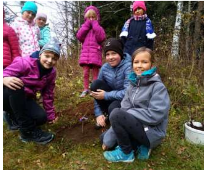
naše nová lípa na školní zahradě

Nezapomněli jsme však také na narozeniny naší republiky a celý jeden den jsme s ní slavili. Darovali jsme jí také dva nové stromy na zahradě.