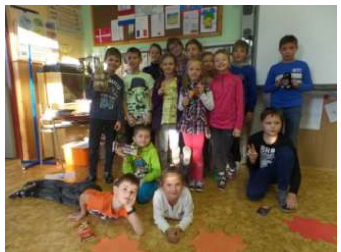
vítězové recitační soutěže