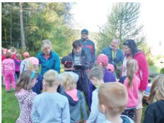
Takhle to vypadalo na startu...