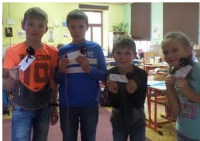
záložky pro kamarády ze Slovenska

Koledovali jsme u kaple sv. Anny a na vánoční besídce v ZŠ. Darovali jsme úsměv našim babičkám a dědečkům na milém setkání s nimi nebo vyrobené záložky kamarádům ze slovenské školy v Kráľové nad Váhom, když jsme se zapojili do projektu „Záložka do knihy spojuje školy“, a tak i nastartovali dopisové přátelství mezi dvěma „československými malotřídkami.“